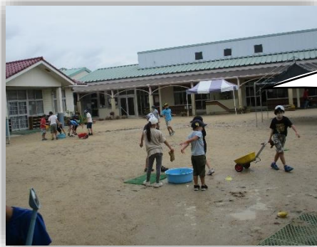
みんなで園庭の水たまりをなくそう!