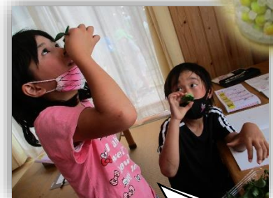
梅なのに“マスカット”の匂いがするよ!