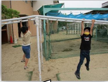
久々にうんていしたよ。

雨が降ると水たまりができて戸外でのあそびが限られてきますが、こどもたちはその中でもリレーやゴム跳びをしたり鬼ごっこをしたりと、あそびのレパートリーを豊富に持っています。中にはベンチやタイヤを組み合わせてアスレチックを作る子もいました。室内ではさまざまな色合いの紫陽花や表情のてるてる坊主を作って飾ったり、支援員が持ってきた梅の匂いを楽しんだりしました。その季節でしか楽しめない経験をこれからも味わっていきたいです。