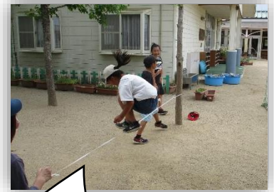
高いけど、飛べるかな?