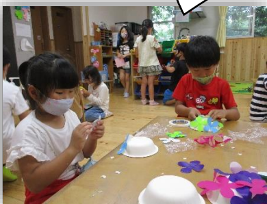
どこに花びら貼ろうかな。