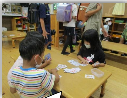
順番に数字を重ねていくよ。どっちが早いかな?