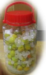
梅シロップ熟成中